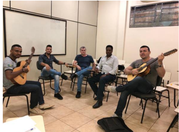
Reunião realizada com os professores no Viena Educar. Em 15 de Abril de 2019.