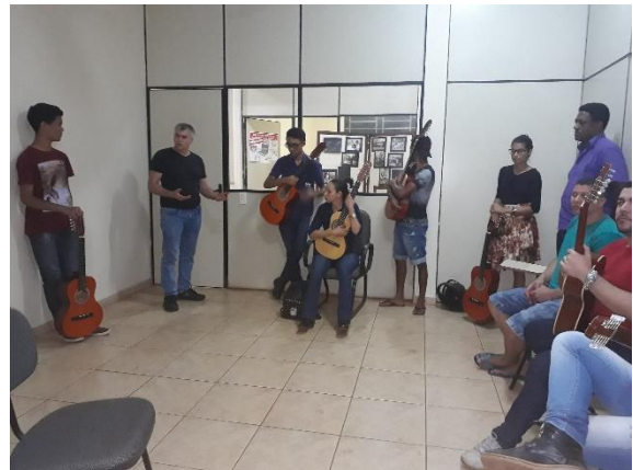
3ª turma pela noite com 25 alunos.

As aulas estão acontecendo às terças e quartas-feiras com turmas nos horários da manhã, tarde e noite. Os participantes estão bastante animados, pois é a primeira vez que um projeto deste nível vem para a cidade de Açaílandia.