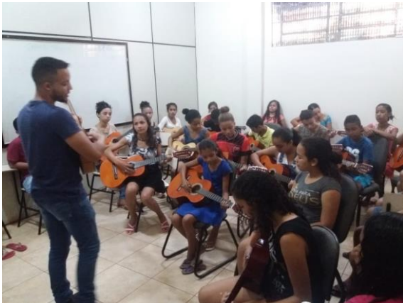
1ª turma pela manhã com 34 alunos.

Nesta terça-feira dia 07 de maio de 2019, foi iniciada as primeiras aulas do curso, onde o mesmo terá duração de 10 meses.