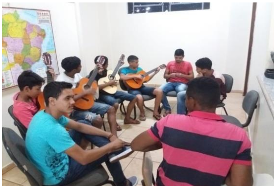
2ª turma pela tarde com 28 alunos.

No projeto serão atendidos uma média de 100 moradores da Comunidade de Pequia, nessa primeira etapa.