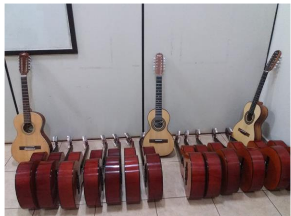
Instrumentos fornecidos para o aprendizado dos alunos

Os alunos serão ensinados a construir e tocar seu próprio instrumento (viola), construído a partir de madeira de reflorestamento, todo esse material didático de produção dos instrumentos está sendo fornecido pela Viena Siderúrgica S/A, através do Viena Educar.