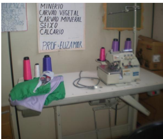
Kits de corte e costuras doados.

Foram doadas 6 máquinas de corte e costura pela parceria Viena, Rotary Clube e Associação Comunitária e Social da Vila Ildemar. O objetivo é proporcionar às mães de família do Pequiá a profissionalização na arte de corte e costura, para que possam obter algum tipo de renda complementar para suas famílias.