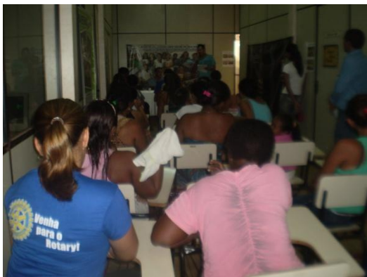
Solenidade de entrega de cheque à Associação(ASCOVI)

Foram doadas 6 máquinas de corte e costura pela parceria Viena, Rotary Clube e Associação Comunitária e Social da Vila Ildemar. O objetivo é proporcionar às mães de família do Pequiá a profissionalização na arte de corte e costura, para que possam obter algum tipo de renda complementar para suas famílias.