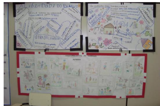
Sala – 05 trabalho Escravo