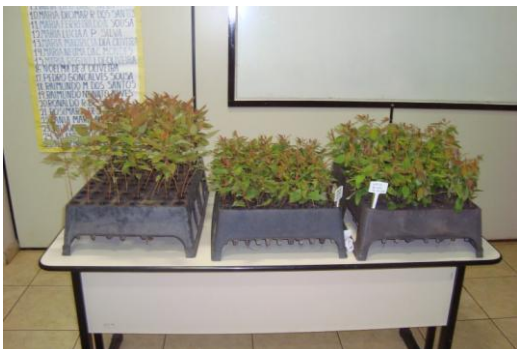
Sala – 02 Setor Agropecuário