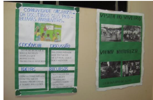
Sala – 04 Impacto das atividades econômicas no Meio Ambiente

As duas últimas semanas foram dedicadas para apresentação dos trabalhos de conclusão dos cursos das turmas de alfabetização. As turmas se juntaram e desenvolveram trabalhos envolvendo os mais variados temas.