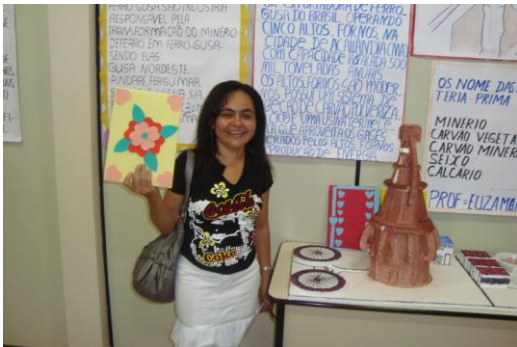
Sala – 01 As indústrias