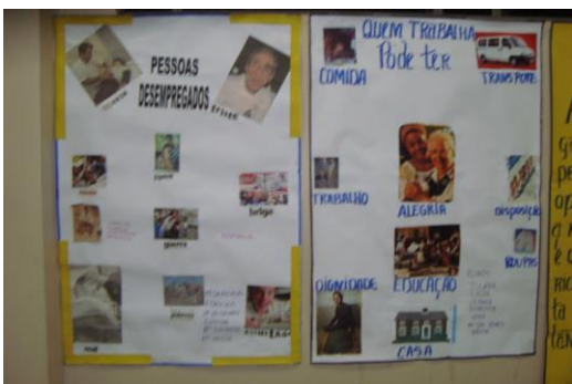
Sala – 03 Direitos Trabalhistas

12/11/2010 foi realizada a última reunião do Conselho Gestor com os representantes das parceiras do Projeto para o encerramento do Programa de Alfabetização de Jovens e Adultos do Viena Educar.