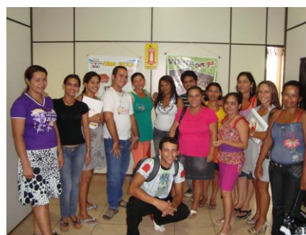
Alfabetizadores do Projeto Viena Educar