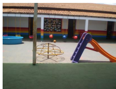
Pátio da escola